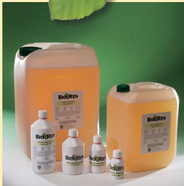
BIOREN® ist eine eingetragene Marke der Österreichischen Laberzeugung Hundsbichler GmbH.

Unterschiedliche Traditionen in den einzelnen Ländern, aber auch die unterschiedlichen Käsesorten erfordern eine jeweils unterschiedliche Stärke und Zusammensetzung von Naturlab. Der Chymosinanteil von BIOREN® Labextrakt flüssig kann von 50 % bis 94 % eingestellt werden. Die Labstärke wird mit bis zu 350 IMCU = 30.000 Soxhlet ebenfalls nach Kundenwunsch geliefert. Die Verpackungsgrößen reichen von der kleinen Flasche mit 50 ml bis zum Großcontainer mit 1200 kg. Wir sind in der Lage, das gesamte Spektrum vom kleinen Eigenproduzenten bis zur industriellen Großkäsefertigung abzudecken. Sonderwünsche nach Labextrakt aus Mägen einer bestimmten Herkunft können ebenso erfüllt werden wie z. B. die Produktion ohne Konservierungsstoffe.